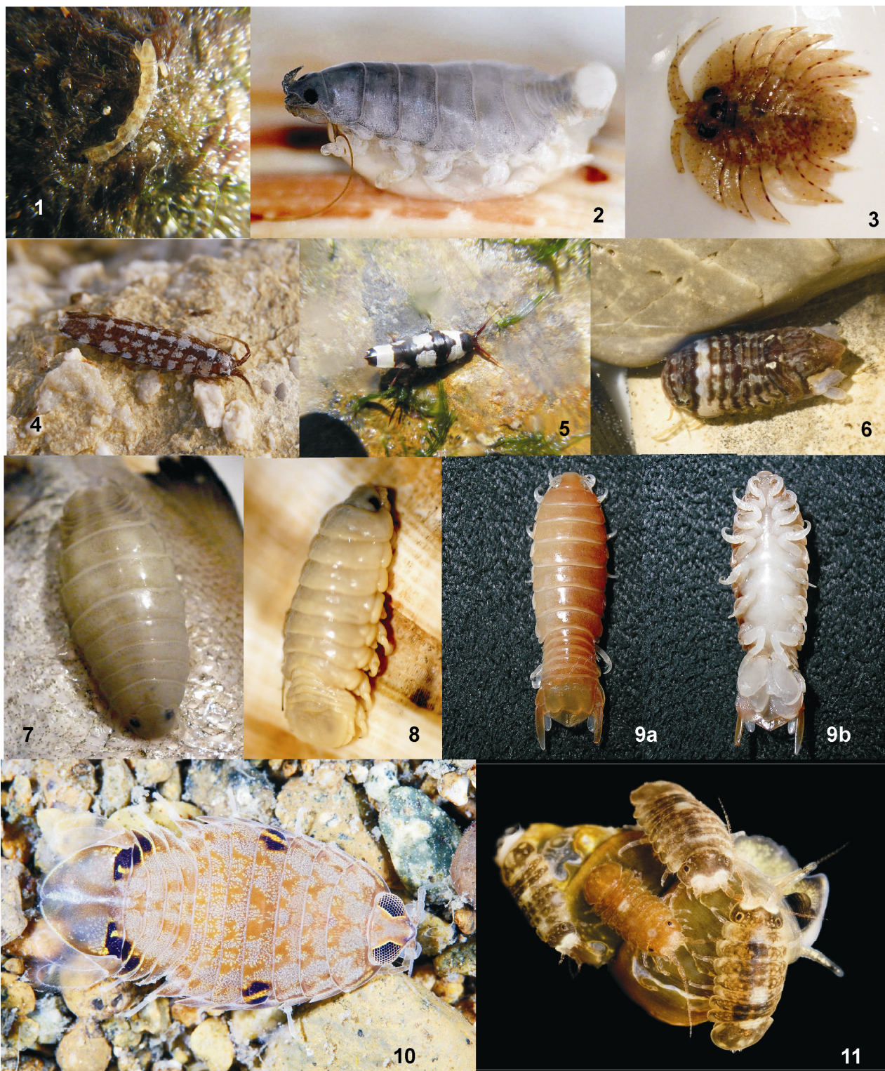
Lámina I: 1. Anthuridea: Cyathura carinata (Kröyer, 1847). 2. Cymothoidea: Anilocra capensis Leach, 1818. 3. Sphaeromatidae: Serolis sp. 4. Valvifera: Idotea balthica (Pallas, 1772). 5. Valvifera: Idotea balthica (Pallas, 1772). 6. Sphaeromatidae: Cymodoce sp. 7. Cymothoidea: Anilocra physodes (Linnaeus, 1758). 8. Cymothoidea: Cymothoa exigua (Schioedte & Meinert, 1884), parásito de la lengua de peces. 9. Cymothoidea: Cymothoidea sp. a) dorsal, b) ventral. 10. Sphaeromatidae del mar de Japón. 11. Asellota: Jaera albifrons Leach, 1814.

Algunos miembros de la familia Cirolanidae son considerados en ocasiones como parásitos de peces, pero según otros autores su asociación sería de otro tipo, más próxima a la microdepredación (Bunkley-Williams & Williams, 1998).