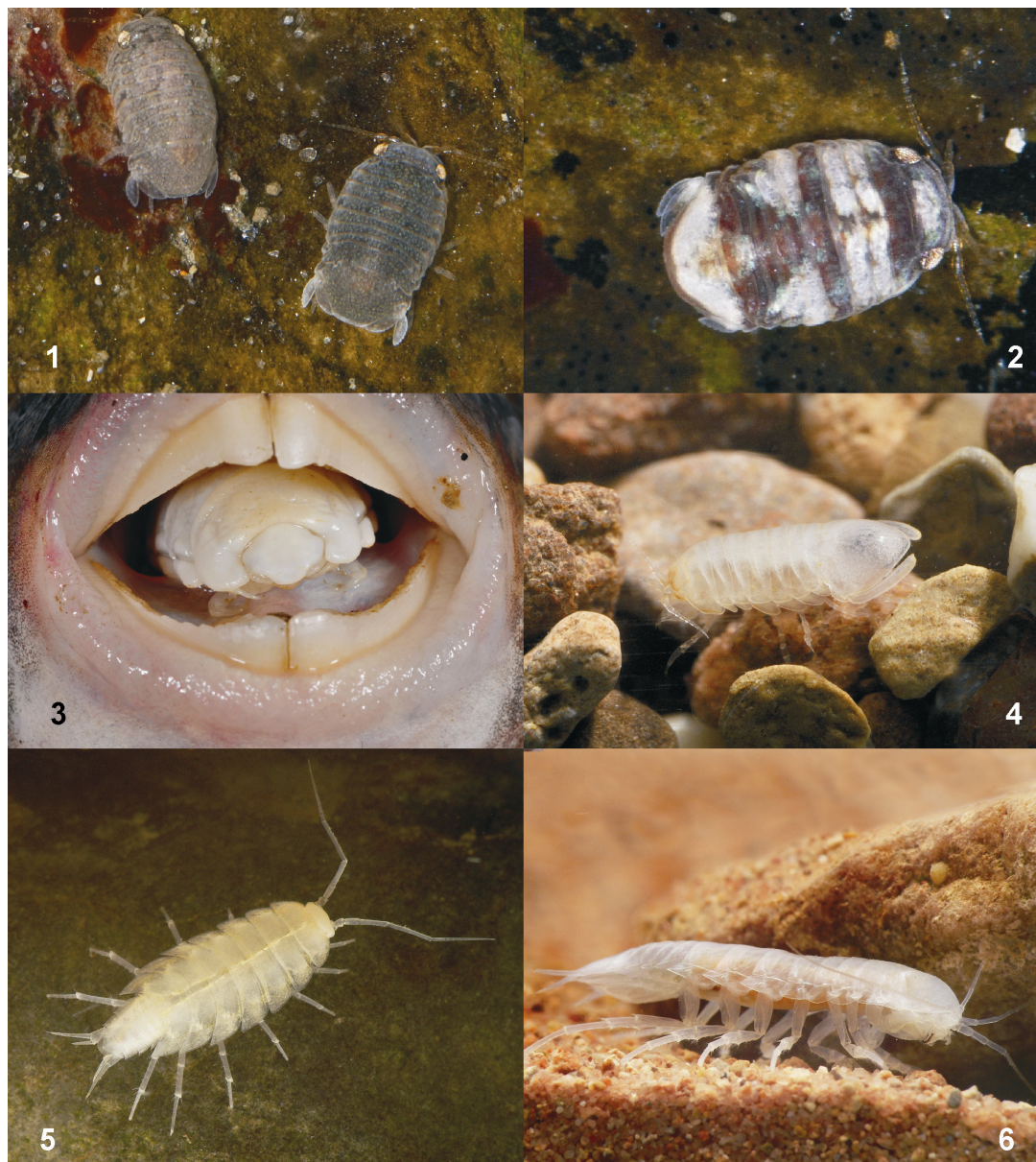
Lámina II. 1-2: Spherosoma sp. La Coruña. 3: Cymothoa sp. isópodo devorador de lenguas. 4-6: Isopoda de agua dulce: 4. Kensleylana briani ; 5. Macedonethes castellonensis ; 6. Typhlocirolana troglobia .