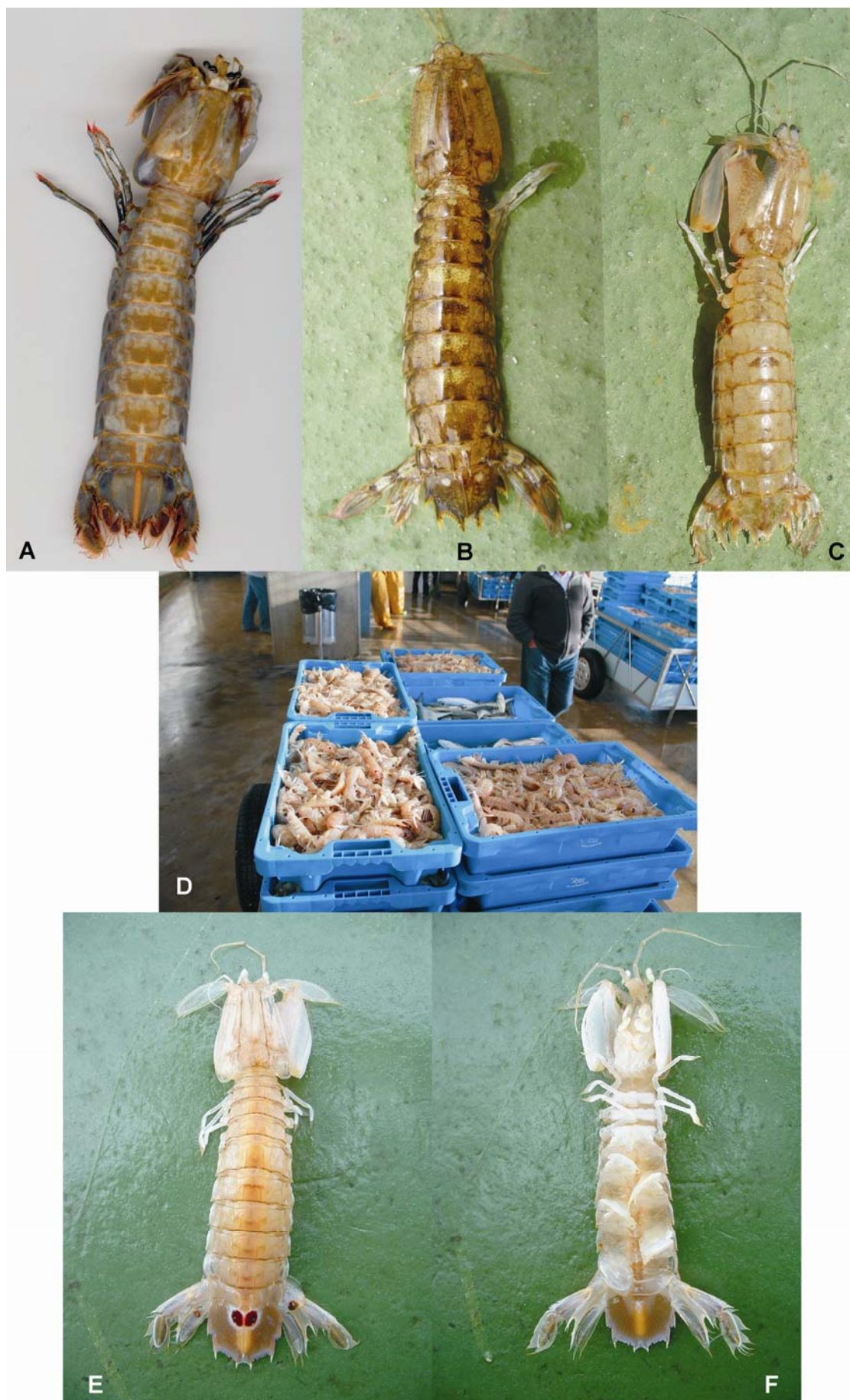
Lámina I: Estomatópodos: A: Parasquilla ferussaci . B: Rissoides desmaresti . C: Rissoides pallidus . D-F: Squilla mantis .