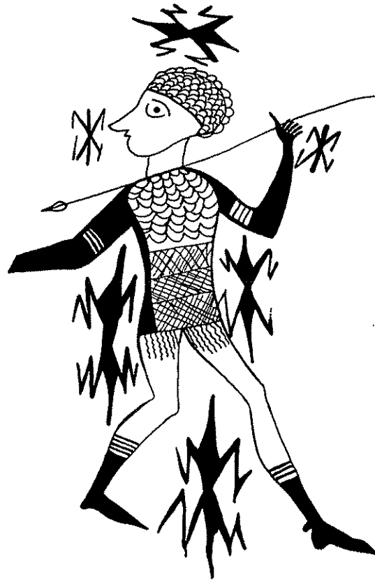
Fig. 1: Detalle del 'vaso de los guerreros' de San Miguel de Liria (Valencia).

La representación de insecto más difundida en la cerámica ibérica, y la que ha despertado más polémicas, es la figura de aspecto geométrico, muy estilizada, que se conoce, de forma convencional, con el nombre de zapatero 3 . Aparece en varias decenas de vasos, con pequeñas variaciones de tamaño y forma (fig. 1-3). En San Miguel de Liria (Valencia), el 25% de los vasos con decoración compleja incluyen al menos un zapatero . Ha sido identificado como un insecto acuático, un rayo jupiterino, una representación antropomorfa esquemática, o un monograma simbólico. Ninguna de estas interpretaciones es plenamente satisfactoria, dado el polimorfismo del motivo y, sobre todo, dada la asombrosa variedad de situaciones en que aparece.