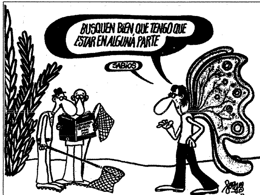
Una variedad de MAVONI: la MARI ■■■■■■■■. (Supongo que el Forges no me demandará por insertar esta viñeta suya en revista tan "comercial").

Sueño a menudo con aquel pedazo de auténtica mata atlántica, en donde no me importaba que las MAVONI,s fueran casi todas y en donde la biodiversidad era apabullante incluyendo, esto sí, una excesiva variedad de dípteros que le dejaban a uno hecho una llaga.