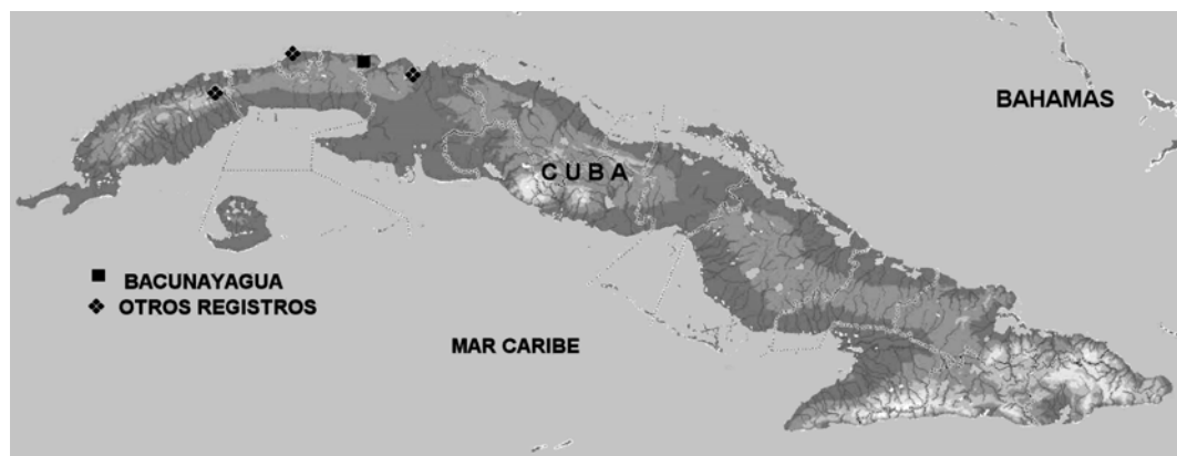
Fig. 2. Localidades cubanas donde ha sido recolectada la libélula Celithemis eponina .