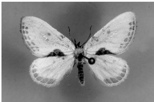
Fig. 1. Cilix hispanica Pérez De-Gregorio et al. , ♀, Llanes (Asturias), 3. X. 2003.

Cilix glaucata ha sido citada de Asturias (en concreto, de Oviedo) por Landeira (1979). Hasta el momento no ha sido posible examinar el(los) ejemplar(es) en los que se basó aquella mención, pese a haberlo interesado del autor de la misma.