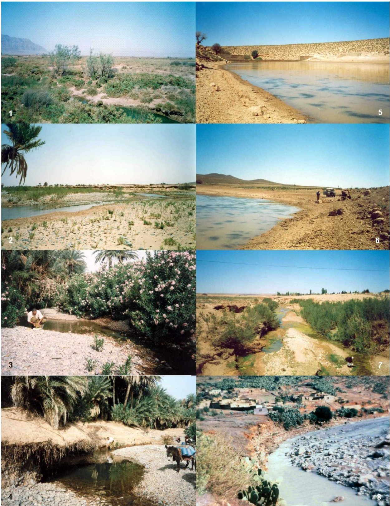
Photos : 1. Mares saumâtres en amont de la confluence Défilia-Zousfana. 2. Oued Zousfana. 3. Oued Défilia. 4. Oued Défilia : impact d'activités humaines. 5. Barrage collinaire au sud du col de Jérada. 6. Barrage collinaire au sud du col de Jérada : impact d'activités humaines. 7. Petit affluent de l'oued Za. 8. Oued Zeghzel en crue.