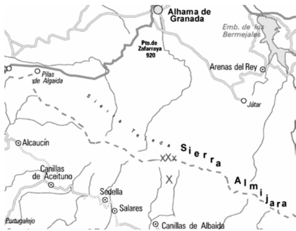
Fig. 1. A. violetae : distribución conocida (zonas con 'X').

cromosomas, o citotaxonomicos, y técnicas de biología molecular, como diagnóstico para clarificar la sistemática y taxonomía del género. La descripción del cariotipo es un requerimiento necesario actualmente para describir nuevas especies Agrodiaetus . Así, por ejemplo, usándose estos métodos, las poblaciones incluidas antes dentro de la especie Agrodiaetus ripartii (Freyer, 1830) en Italia, se han separado en tres especies distintas, con n = 38 , 66 y 90 cromosomas respectivamente, siendo la de n = 90 la correspondiente a A. ripartii .