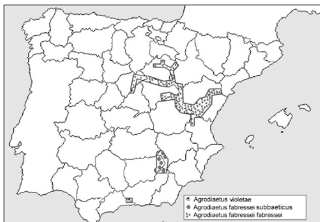
Fig. 14. Distribución de A. violetae , A. f. fabressei y A. f. subbaeticus ssp. nov.

En el extremo suroeste de la provincia de Murcia, existe una pequeña población de Agrodiaetus fabressei , de muy probable conexión geográfica con las poblaciones de Agrodiaetus del norte de la provincia de Granada y sur de Albacete, de la cual no hemos podido examinar ningún ejemplar. Probablemente, esta última población se adscribe a A. fabressei subbaeticus ssp. nov.