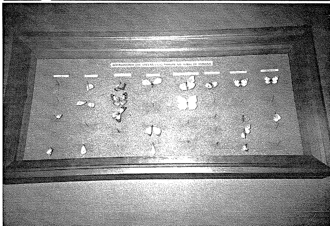
FOTOGRAFÍAS: EXPOSICIÓN DE MARIPOSAS DEL PARQUE NACIONAL DE DOÑANA.