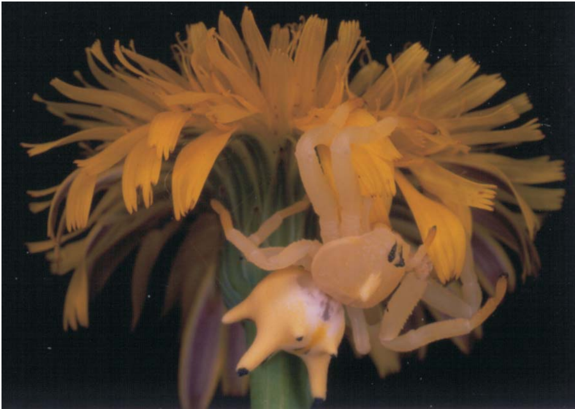
Fig. 1. The spider Epicadus heterogaster (Guérin, 1829) in its natural habitat.

W.R. Lourenço, A.D. Brescovit, C. A. Rheims & J.L. Cloudsley-Thompson