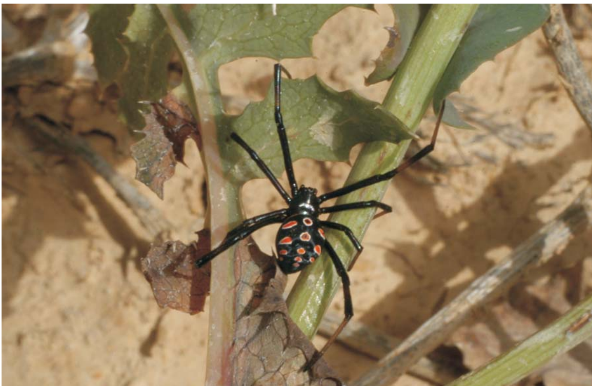
Fig. 1. Latrodectus tredecimguttatus (Rossi, 1790). Olite (Navarra).