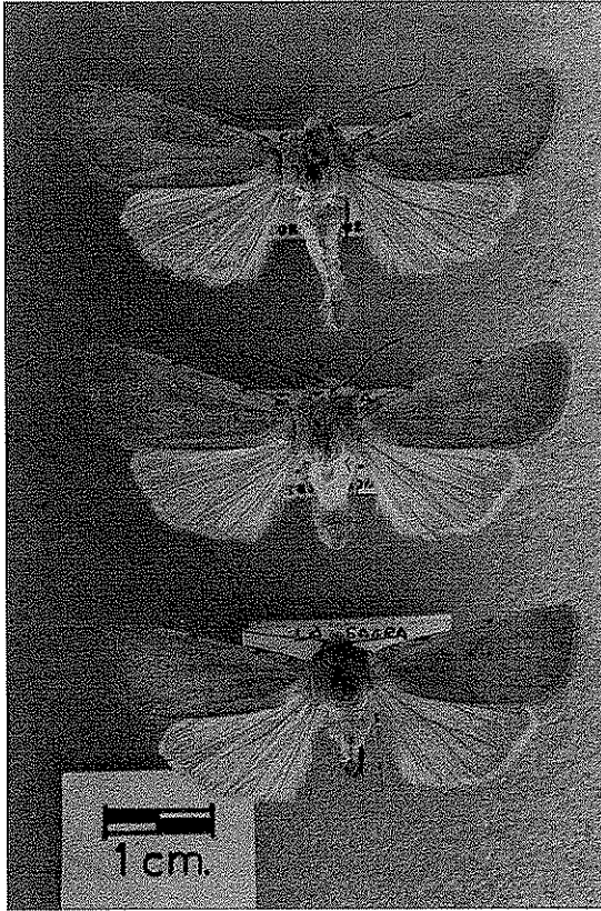
Fig. 2: Tipo y paratipos de Xestia ashworthii (Doubleday, 1855) sagrensis ssp. n.