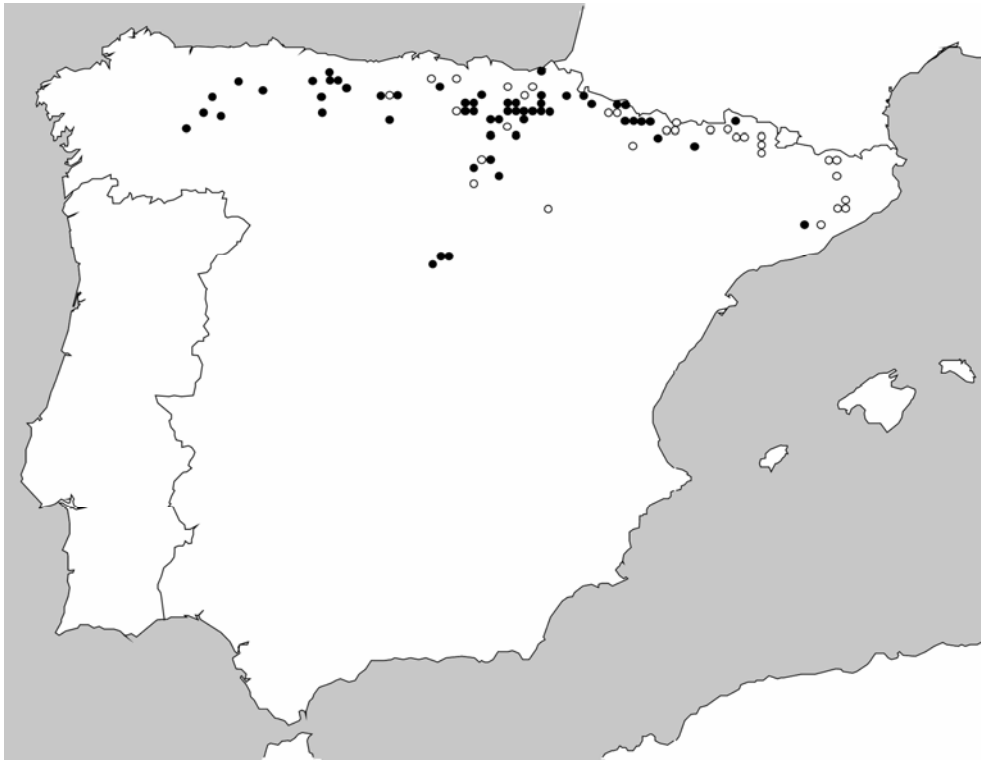
Fig. 1. Mapa de distribución de Sinodendron cylindricum en la Península Ibérica. Los círculos negros indican observaciones a partir de 1980; los círculos blancos indican observaciones hasta finales de 1979.