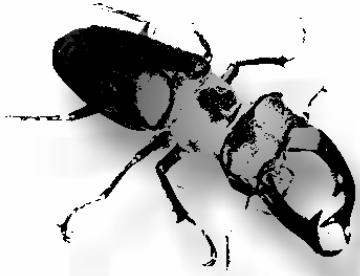
Grupo de Trabajo sobre Lucanidae Ibéricos