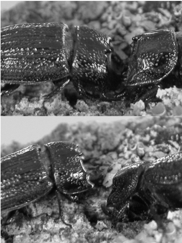
Fig. 4. Fotografías, tomadas por Enrique Murria, que muestran la lucha entre dos machos de S. cylindricum .

padelli, 1989; marzo-agosto: Baraud, 1993; junio-julio: Scherf, 1985; Proches, 1997). Las fechas de captura de ejemplares vivos proporcionadas por los colaboradores o recogidas en las colecciones entomológicas se encontraron, en general, dentro de este rango (Fig. 3). Los machos son más comunes que las hembras (Proches, 1997). No se ha encontrado información sobre el comportamiento reproductor de la especie. Enrique Murria ha observado en terrario que los machos se pelean y se embisten con el cuerno frontal (Fig. 4). Este comportamiento, aunque se ajusta a lo esperable para escarabajos con cuernos (Palmer, 1978; Eberhard, 1980), no parece haber sido descrito previamente en la bibliografía que hemos podido consultar.