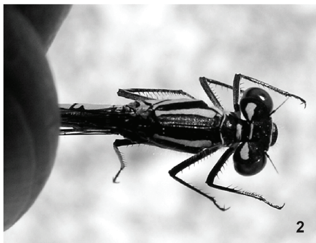
Fig. 1. Mapa de distribució de Coenagrion hastulatum a Catalunya. Fig. 2. Visió dorsal femella de Coenagrion hastulatum .