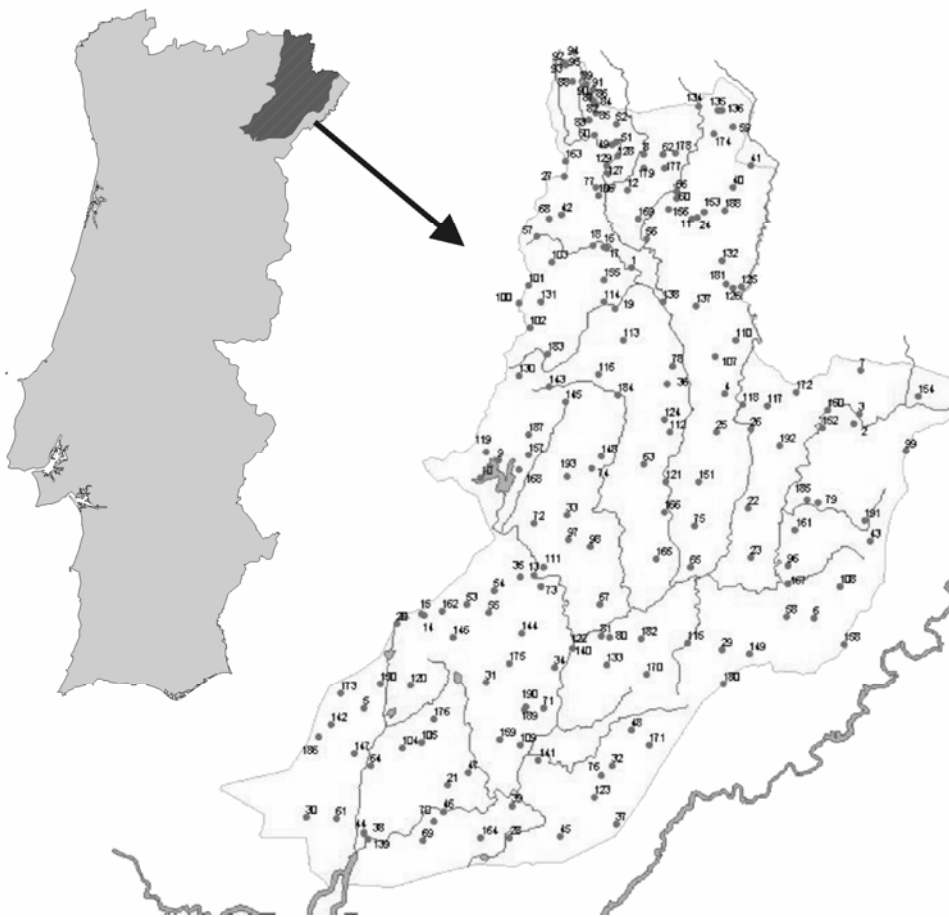
Fig.1. Localização da área de estudo, bacia do Rio Sabor. Pontos de amostragem \beta Anexo 1.

mente, no trabalho de 1972 realiza a primeira contribuição para o conhecimento da fauna de ortopteróides do Arquipélago da Madeira.