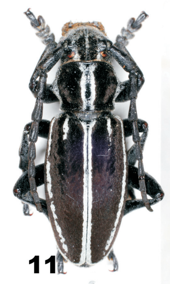
Fig. 1. Holotipo de Dorcadion circumcinctum . Copyright © G. Tavakilian MNHN Paris. Fig. 2. Etiquetado de ejemplar de Fig. 1. Copyright © G. Tavakilian MNHN Paris. Fig. 3. Holotipo de Dorcadion ariasi . Copyright © G. Tavakilian MNHN Paris. Fig. 4. Etiquetado de ejemplar de Fig. 3. Copyright © G. Tavakilian MNHN Paris. Fig. 5. Holotipo de Dorcadion tenuecinctum . Copyright © G. Tavakilian MNHN Paris. Fig. 6. Etiquetado de ejemplar de Fig. 5. Copyright © G. Tavakilian MNHN Paris. Fig. 7. I. (H.) circumcinctum , Monast o Rodilla (Burgos). A. del Saz leg. Fig. 8. I. (H.) circumcinctum , Monast o Rodilla (Burgos). A. del Saz leg. Fig. 9. D. molitor burgense a. argenteovittatum . Sintipo, col. MCCNM. Fig. 10. I. (H.) circumcinctum , Villasur de Herreros (Burgos). A. del Saz leg. Fig. 11. I. (H.) circumcinctum ssp. tenuecinctum , Pto. de Orduña (Burgos). F. Carasa leg.