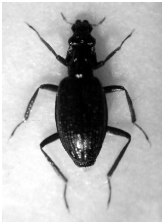
Fig. 2. Habitus de O. notabilis Rosenhauer, 1856