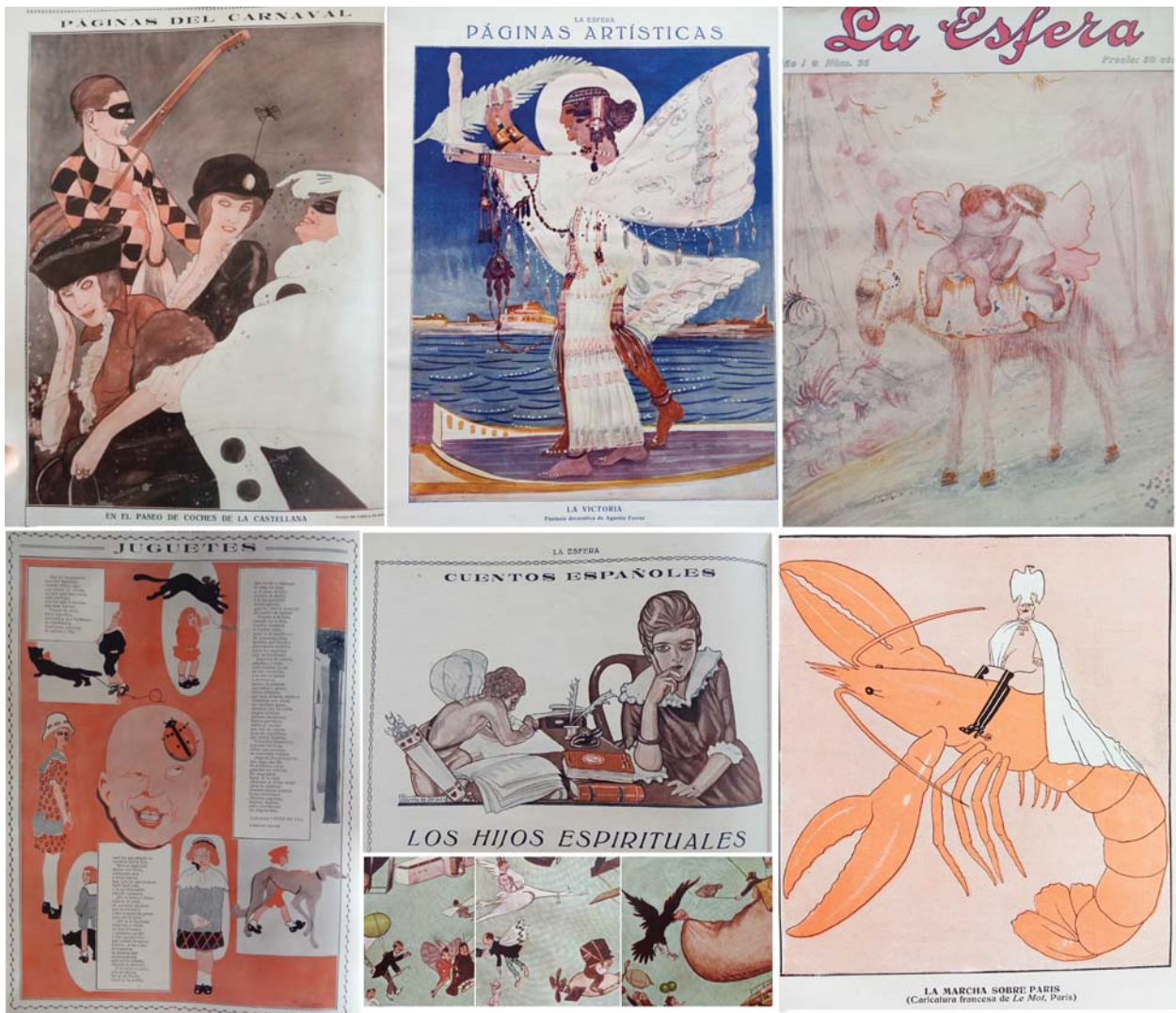
Lámina 3: Diversas imágenes relacionadas con la Entomología: Primera fila: Páginas del Carnaval , año II, Nº 60, 1915. Dibujo de Varela de Seijas; La Victoria , año I, Nº 36, 1914. De Agustín Ferrer; Idilio , año I, Nº 36, 1914, De Agustín Ferrer. Segunda fila: Juguetes , año II, Nº 53, 1915. Texto de Leopoldo López de Sáa, dibujos de Galván; arriba: Cuentos españoles , año III, Nº 146, 1916. (Texto no incluido de Miguel de Unamuno), dibujo de Varela de Seijas; abajo: La Conquista del aire , año II, Nº 53, 1915. Caricaturas de Pellicer; La Marcha sobre París , año II, Nº 54, 1915. Caricatura de Le Mot , París.