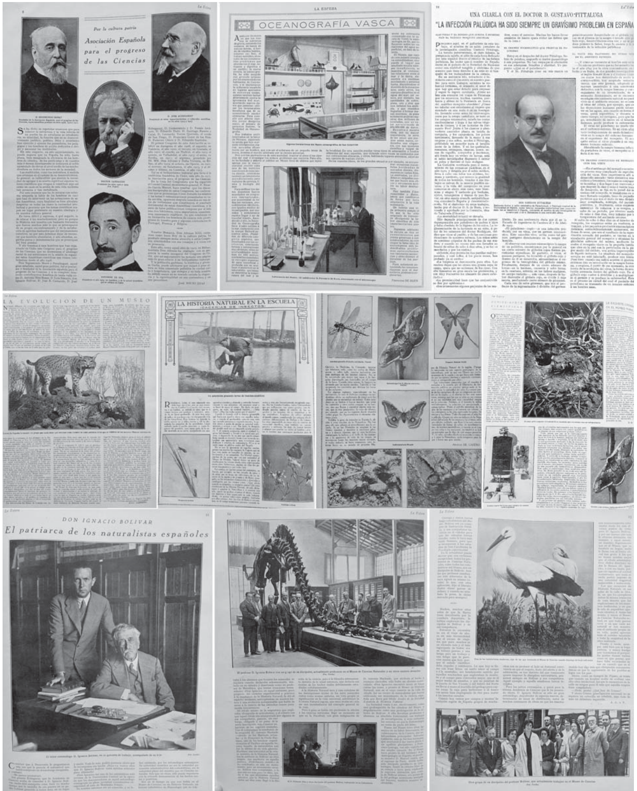
Lámina 2: Diversos reportajes relacionados con la Entomología: Primera fila: Por la cultura patria. Asociación Española para el progreso de las Ciencias , año XIV, Nº 696, 1927. Texto de José Recio Díaz; Oceanografía Vasca , año III, Nº 141, 1916. Texto de Fernando de Buen; Entrevista sobre el paludismo al Dr. Gustavo Pittaluga (part.), año XV, Nº 763, 1928. Texto H.R. de la Peña. Segunda fila: La evolución de un museo , año XI, Nº 556, 1924. Texto de Ángel Cabrera; La Historia Natural en la Escuela (Cacerías de insectos) , año III, Nº 150, 1916 (dos páginas). Texto de Amadeo de Castro; Curiosidades científicas , año XI, Nº 549, 1924. Texto de D.R., fotos de Díaz. Tercera fila: Don Ignacio Bolívar. El patriarca de los naturalistas españoles , año XV, Nº 753, 1928 (tres páginas). Texto de A.G. y F., Fotos Cortés. Plate 2: Various reports related to Entomology: First row: For the homeland culture. Spanish Association for the Progress of Sciences , year XIV, Nº 696, 1927. Text by José Recio Díaz; Basque Oceanography , year III, Nº 141, 1916. Text by Fernando de Buen; Interview on malaria with Dr. Gustavo Pittaluga (part.), year XV, No. 763, 1928. Text by H.R. de la Peña. Second row: The evolution of a museum , year XI, Nº 556, 1924. Text by Ángel Cabrera; The Natural History in the School (Insect hunts) , year III, Nº 150, 1916 (two pages). Text by Amadeo de Castro; Scientific curiosities , year XI, No. 549, 1924. Text by D.R., photos by Díaz. Third row: Don Ignacio Bolívar. The patriarch of the Spanish naturalists , year XV, Nº 753, 1928 (three pages). Text by A.G. and F., photos by Cortés.