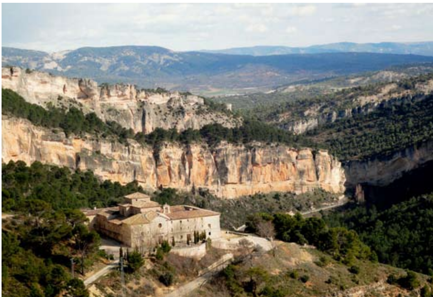
Alrededores del Monasterio de San Miguel de la Victoria.