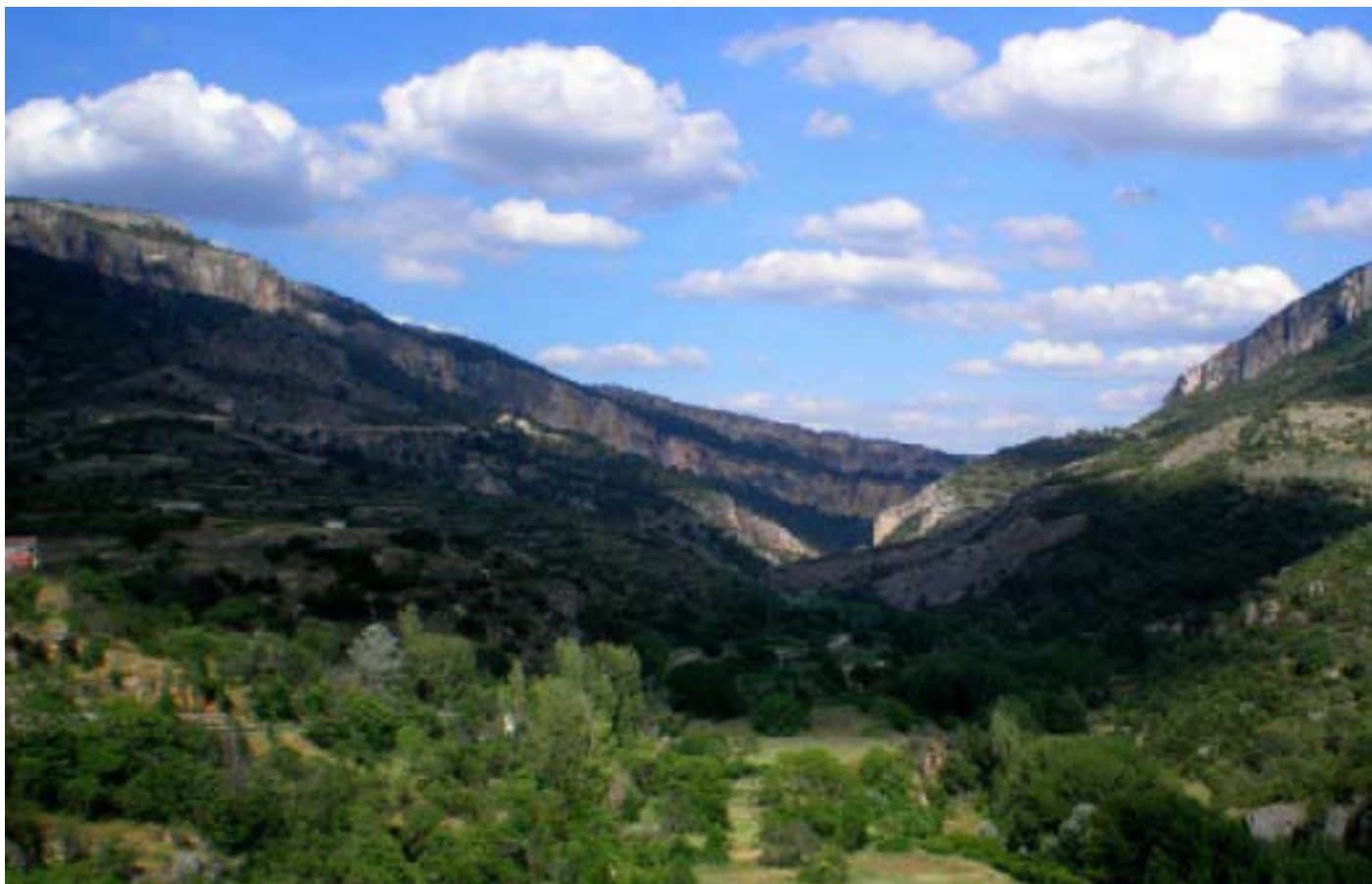
Vistas del Estrecho de Priego desde el Monasterio de San Miguel de la Victoria.