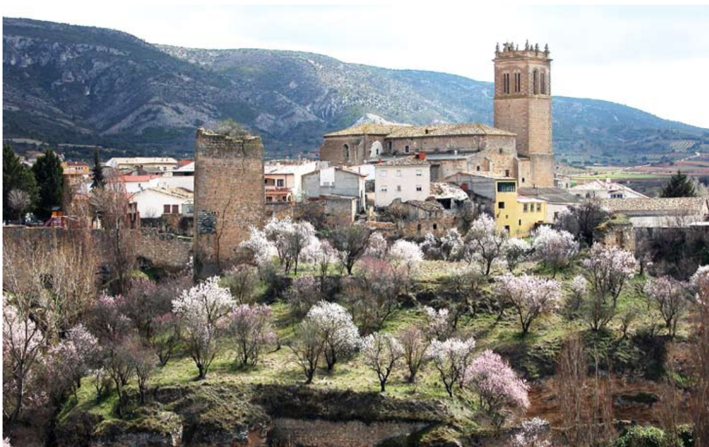
Vista parcial de la localidad de Priego (Cuenca)